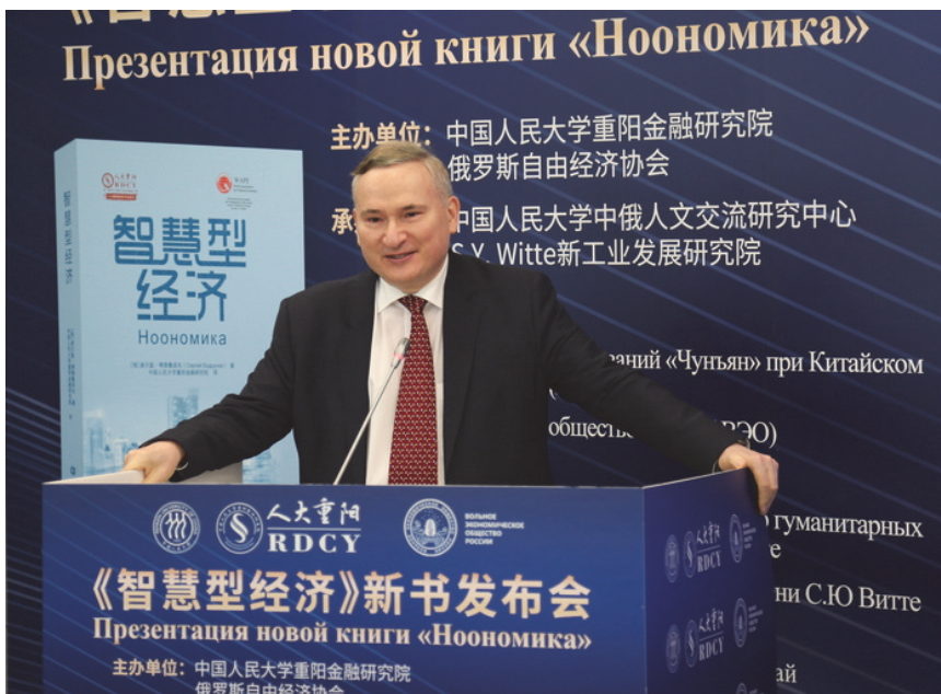
Сергей Бодрунов, член-корреспондент РАН

Три дня назад я получил экземпляры книги «А(О)нтология ноономики: четвертая технологическая революция и ее экономические, социальные и гуманитарные последствия», изданной в Нидерландах и США. Думаю, что скоро десятки экземпляров книги получит Институт финансовых исследований «Чунъян» Китайского народного университета и Китайская академия социальных наук, потому что одним из авторов книги является профессор Чен Энфу, выдающийся специалист с мировым именем и мой хороший друг. Он формулирует теорию интеллектуальной экономики, а я отмечу, что интеллектуальная экономика и ноономика очень близки идеологически как теории разумного управления общественным развитием. Профессор Чен считает, что ноономика является мощным движущим фактором развития «умной» экономики. У нас много коллег, которые активно взаимодействуют в исследовании сферы управления развитием общества.