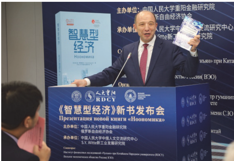
В.Л. Квинт, иностранный член РАН

Владимир Квинт: Коллеги, мы наблюдаем, как теория переходит в практику, мы являемся свидетелями того, что ноономика должна найти свой собственный путь, ведущий к развитию экономики будущего и будущего мировой экономики, такое мышление составляет основу книги профессора Бодрунова. В начале мы видим, что следует использовать теорию и метод стратегической формулировки, курс нашего сотрудничества есть курс нашего взаимодействия, это теория и метод ноономики и формулирования стратегического плана.