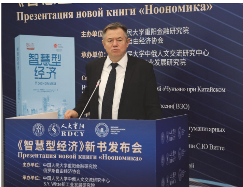
С.Ю. Глазьев, академик РАН

Сергей Глазьев: Уважаемые коллеги, я хотел бы напомнить всем, что теория ноономики является результатом долгосрочных исследований эволюции, а также результатом долгосрочной эволюции человеческого общества. Как отметил в своей книге ее автор С. Бодрунов, это – принципиально новый процесс индустриализации, экономическая модель, созданная на фоне нового технологического уклада. Сегодня мы уже говорили о долгосрочном цикле, который представляет собой новую технологическую схему, которая принесет новую экономическую парадигму в развитие ноономики, которая также станет основным фактором нашего экономического развития. Развитие робототехники, искусственного интеллекта, биоинженерных исследований выведет промышленность и производство на новый уровень развития. В рамках этого уровня развития люди войдут в новую парадигму творчества.